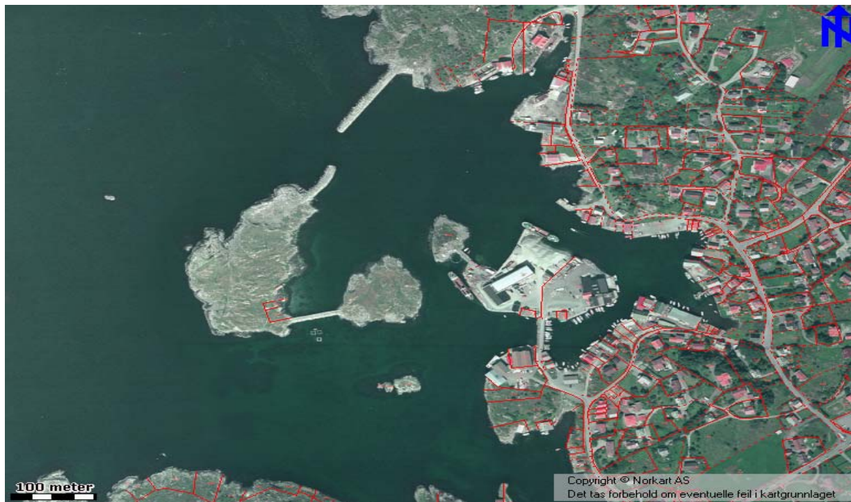
Flyfoto fra Sævelandsvik