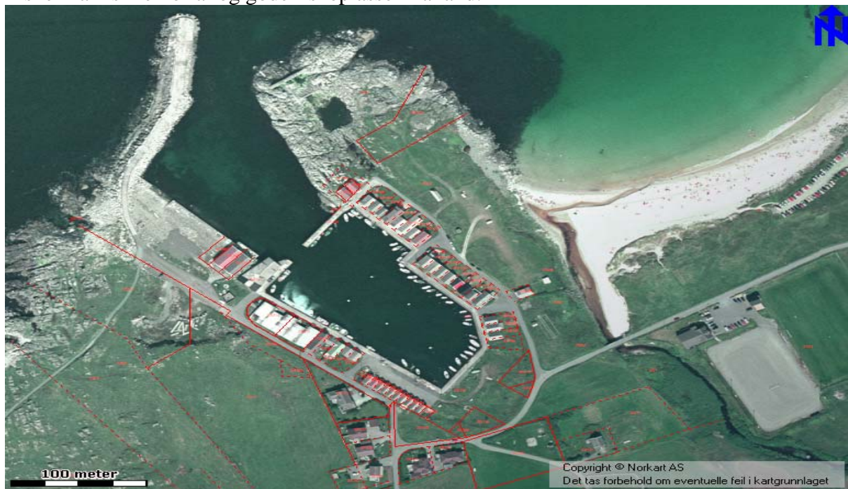
Flyfoto fra Ferkingstad havn

Havna ligger i tilknytning til en flott sandstrand på 300 meters lengde. Her ligger også Ferkingstad Idrettslag med fotballbaner og idrettshus. Kongestien fra Åkrehamn til Ferkingstad går rett forbi havna. Båtnaustene på Hop, Kongsgarden til Kong Ferking, Fishermanns memorial og gode fiskeplasser fra land.