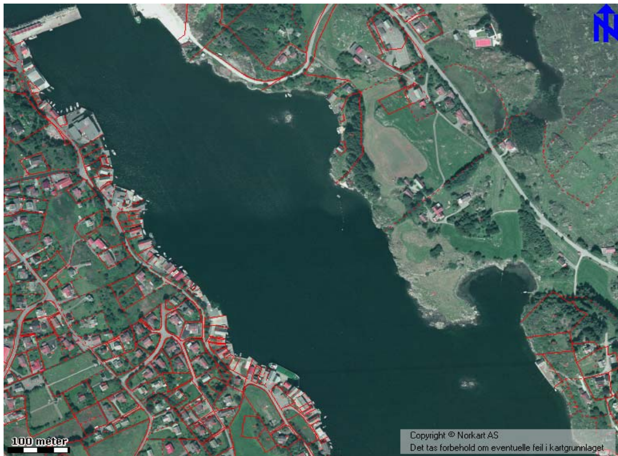
Flyfoto fra Vedavågen

Karmøy Fiskerimuseum ligger i Vedavågen, og bygningen skapte en diskusjon på grunn av designet da det ble bygget. Veabygda er en tradisjonell fiskeribygd og har vært det gjennom generasjoner. Dessverre er det nå lite næring igjen langs havneområdene. Her er det stor muligheter for ny vekst og produksjon av sjømat og andre næringer som har behov for nær kontakt med sjø.